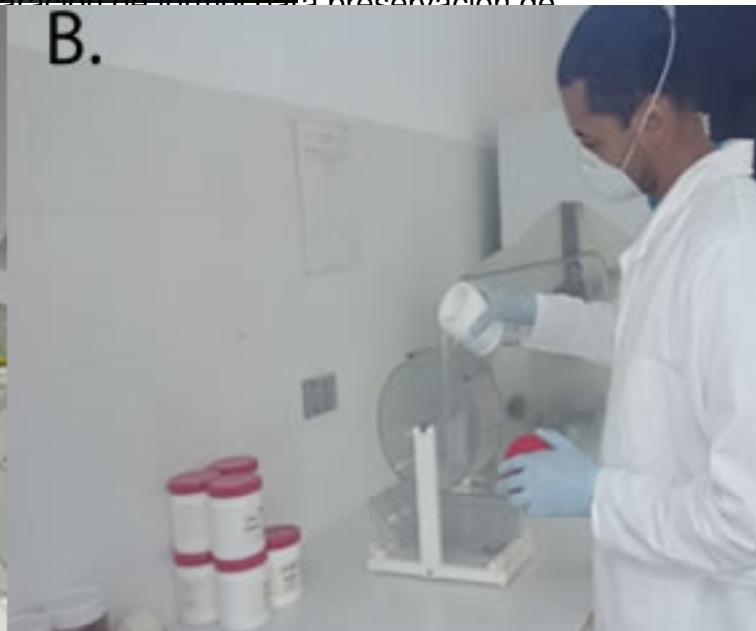
Figura 3. Área de recepción, filtración y división de muestras: (a) Recepción, filtración y división de muestras para el análisis.