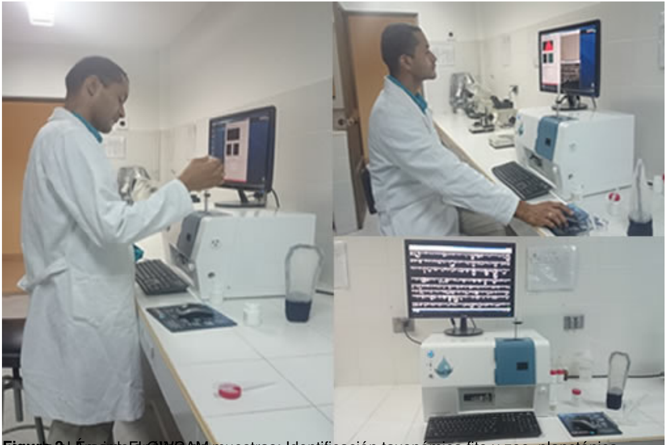
Figura 31. Empleo de QMGAM muestras: Identificación taxonómica fito y zoo planctónica