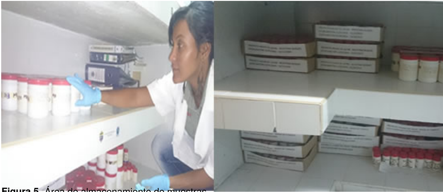
Figura 5. Área de almacenamiento de muestras.