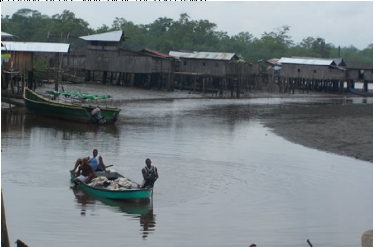
Viviendas construidas en terrenos de bajamar en Salahonda.