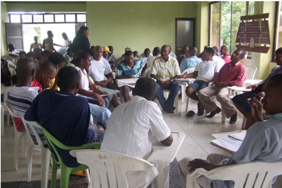
Habitantes del municipio de Francisco Pizarro reunidos durante el taller

65 habitantes del municipio Francisco Pizarro Salahonda, entre pescadores, agricultores, concheras, concejales y líderes comunitarios, participaron en el taller sobre “Concesiones y Permisos de Construcción en Bienes de Uso Público” desarrollado por el Área de Litorales y Protección del Medio Ambiente de la Capitanía de Puerto de Tumaco, con la participación de la oficina de Divulgación Científica y Prensa del Centro Control Contaminación del Pacífico (CCCP). Esta iniciativa de la Alcaldía del municipio, permitió que la comunidad reconociera y apropiara el Decreto Ley 2324 de 1984, teniendo en cuenta que muchas de sus casas se encuentran construidas en terrenos de bajamar y están expuestas a desastres naturales.