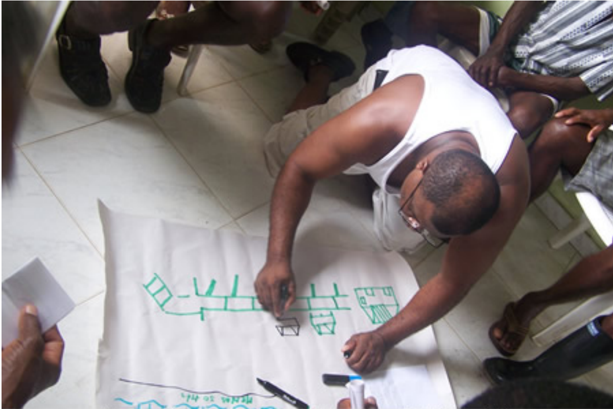
Interpretación que le dan los salahondeños al Decreto ley 2324 de 1984