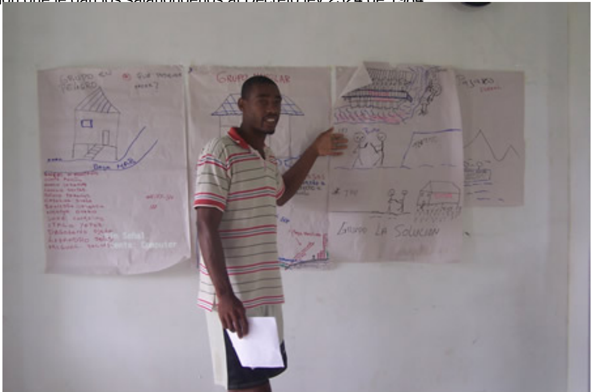
Exposición del Grupo "la Solución" sobre Bienes de Uso Público.